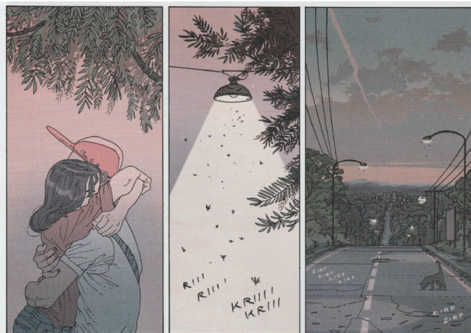
J. Mural, The Fall , Sammelband 1

Information : mardi 5 septembre, à 12h10, salle L104