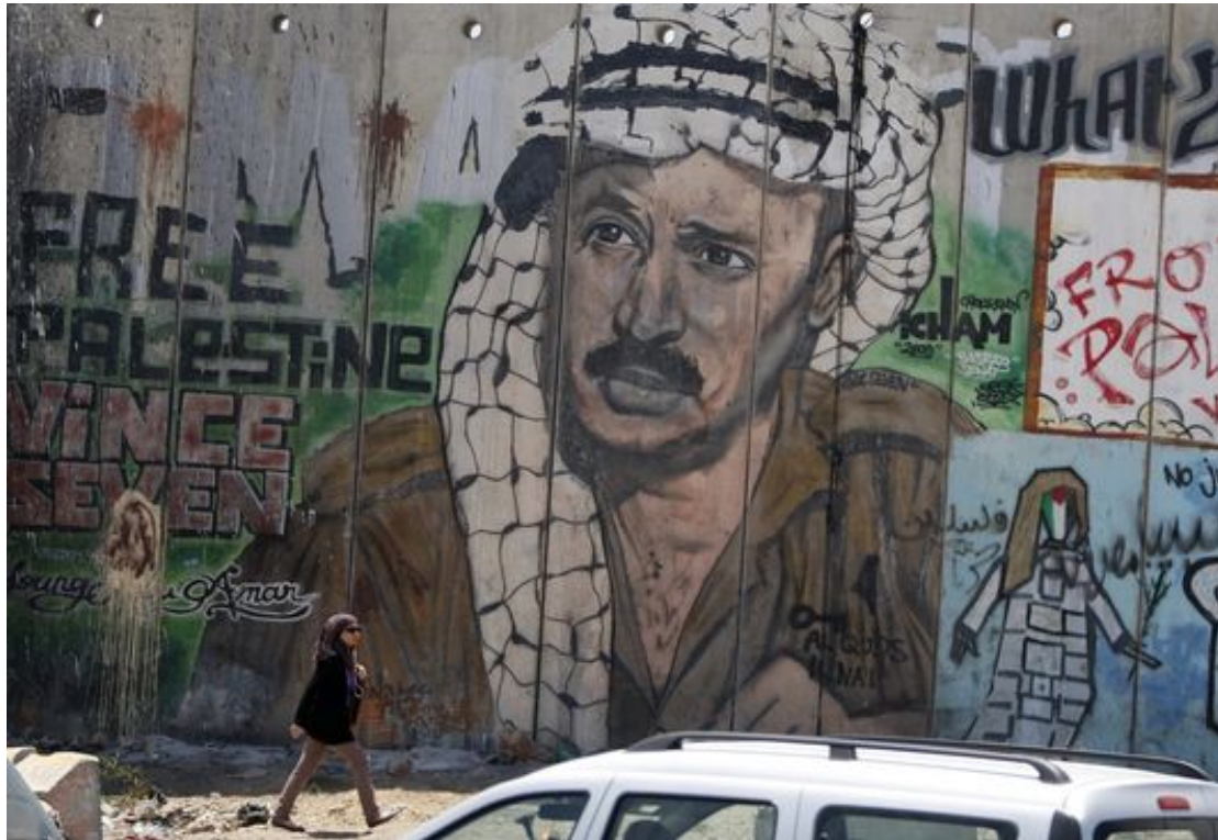
Portrait de Yasser Arafat à Ramallah